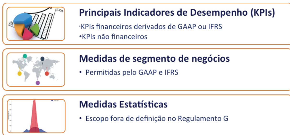
Figura 1. O que é (não) uma medida não GAAP?

Nota: Essa ilustração é baseada na definição do Regulamento G de uma métrica financeira não GAAP, conforme descrito no Tópico 8 do Manual de Relatórios Financeiros da SEC, disponível em https://www.sec.gov/divisions/corpfin/cffinancialreporting manual.shtml .